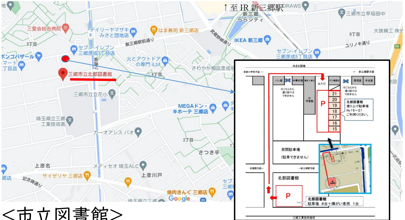
<北部図書館駐車場・借上げ駐車場>